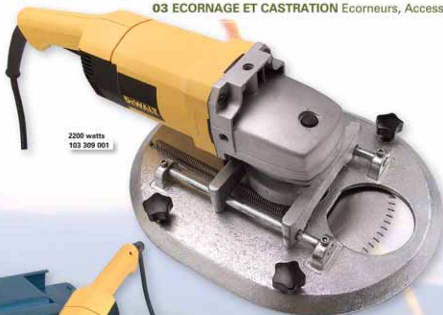
2200 watts 103 309 001