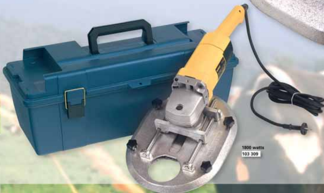
1800 watts 103 309